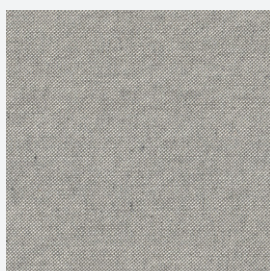
JR4 : GRAFITO