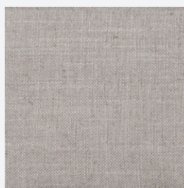
JR5 : NATUREL