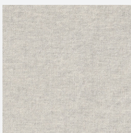
JR3 : CENIZA